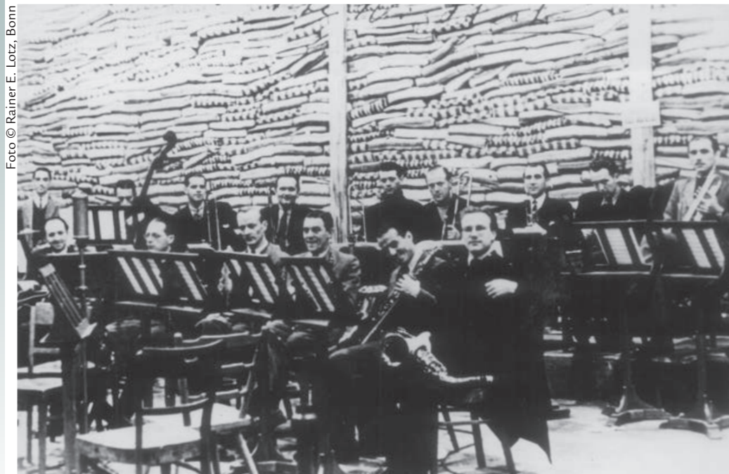
Bandprobe im Matratzenlager, aufgenommen 1942 in einem Nebengebäude des Hauses des Rundfunks in der Soorstraße.